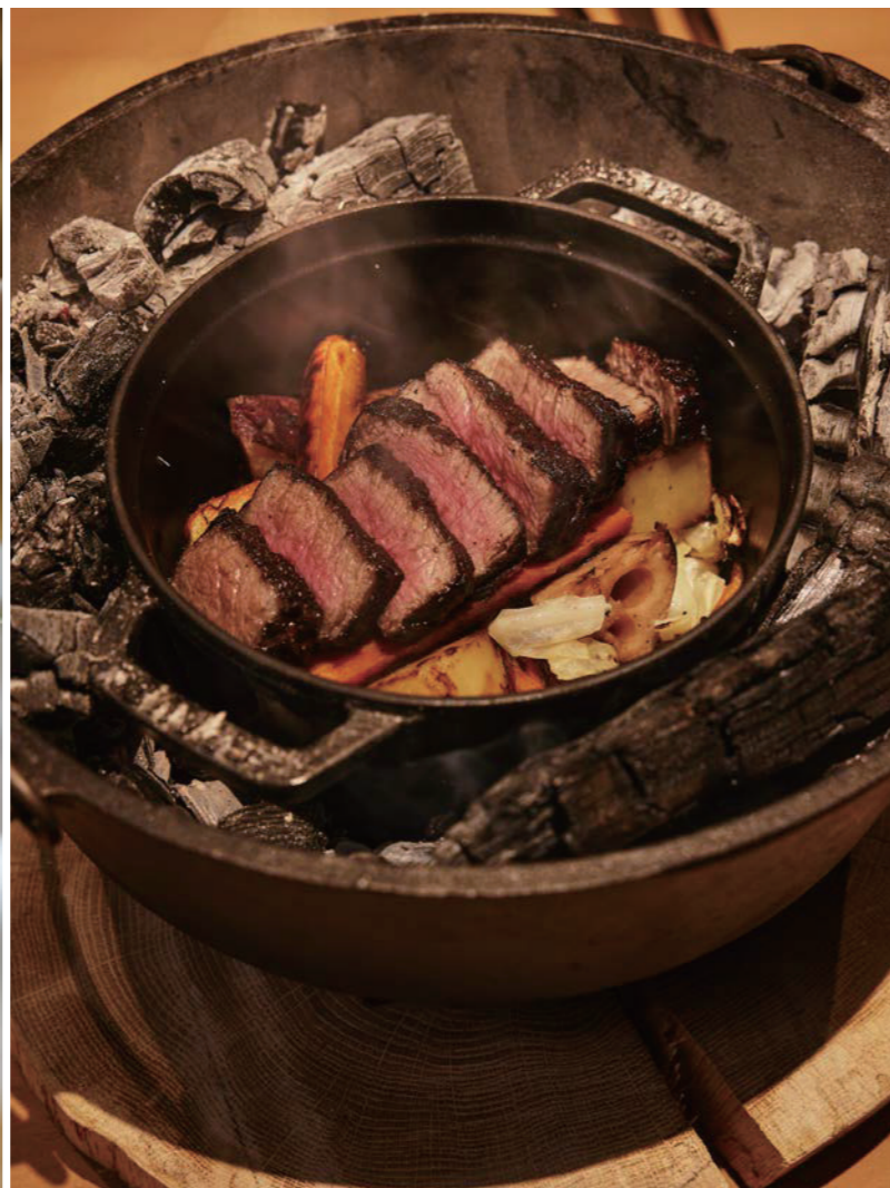
9 ゲストが滞在するヴィラでシェフが料理を仕立ててくれる。ディナーは約10品のコースで、写真は〈前菜三種 栗・秋野菜・銀杏〉。10 ディナーより、炭焼き鯖の三升漬けのスパゲティ。11 かみふらの和牛の炭火ステーキ。12 朝もシェフによる和朝食。季節の食材を盛り込んだモーニングプレート。他に野菜のストウブ蒸しやカレースープも。